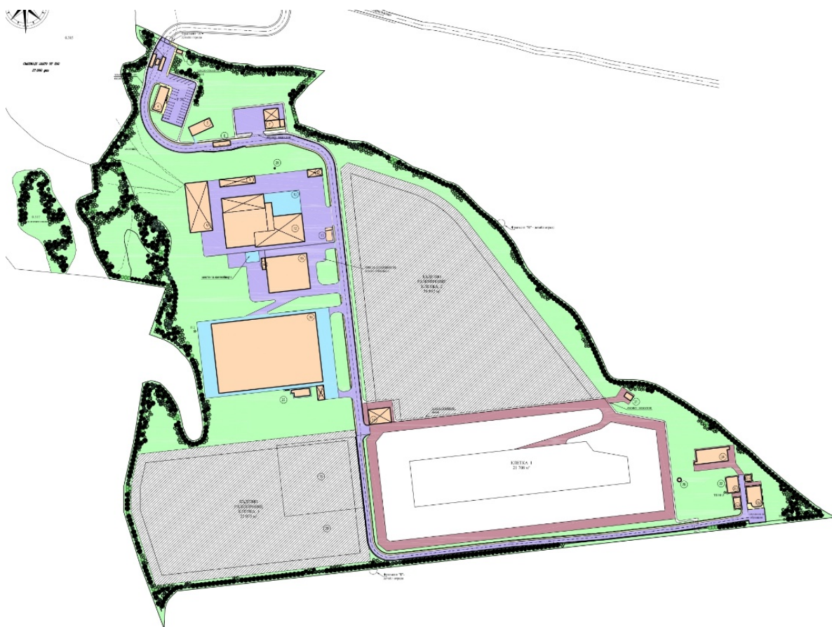
Фигура 2 Генерален план на площадката на РДНО Велико Търново