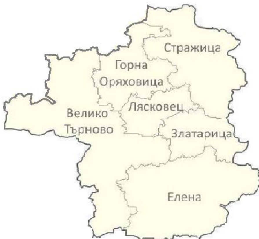
Таблица 1 Площ на общините от Регионалната система за управление на отпадъците регион Велико Търново